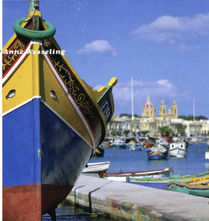
SOUTH DAKOTA OFFICE OF TOURISM, WWW.TRAVELSD.COM