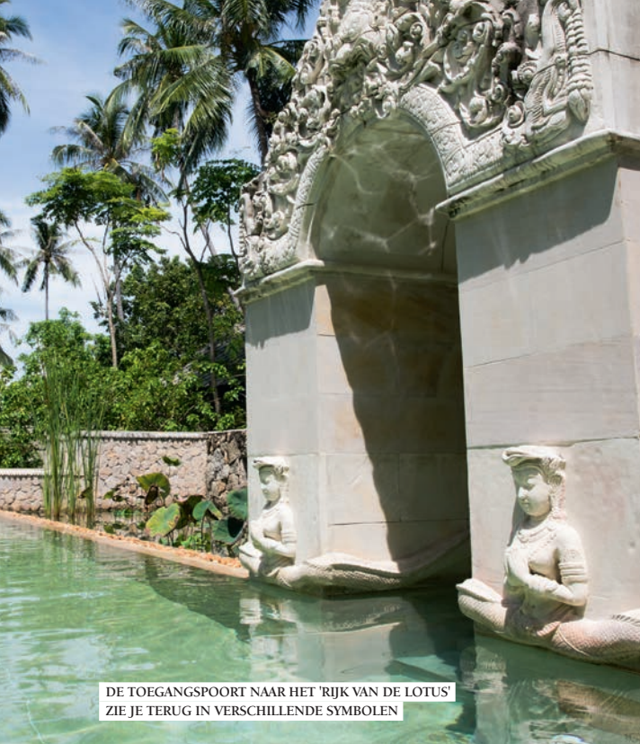
DE TOEGANGSPOORT NAAR HET 'RIJK VAN DE LOTUS' ZIE JE TERUG IN VERSCHILLENDE SYMBOLEN