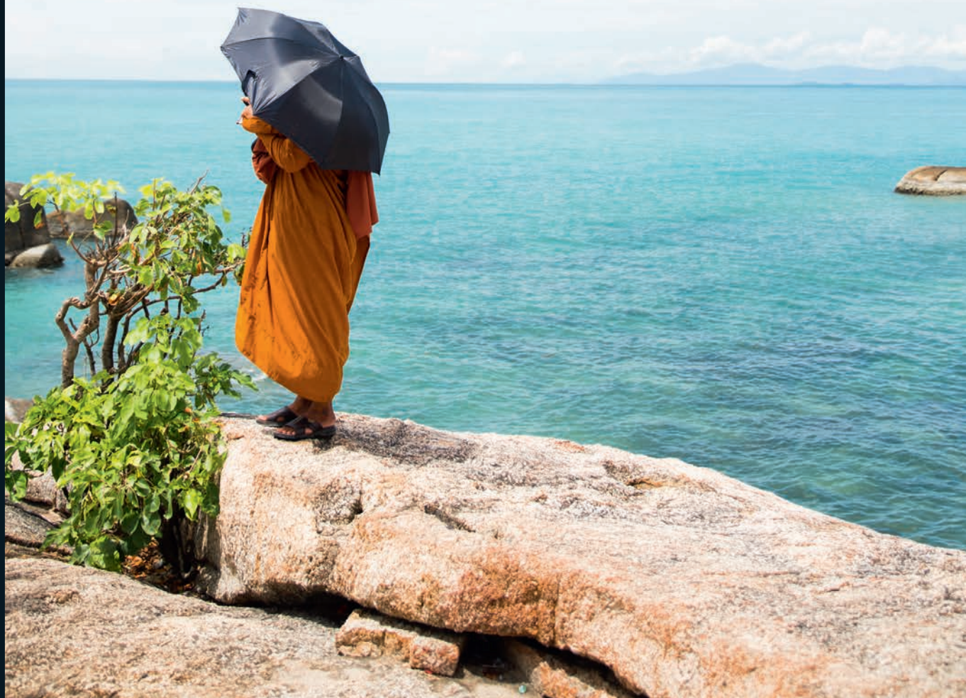
TEKST: KARLJN VISSER

ALS ER EEN PLEK IS WAAR MEN WEET WAT GOED IS VOOR DE MENS, DAN IS HET WELLNESS SANCTUARY KAMALAYA. SUPERFOODS, UITGEBREIDE BEAUTYPROGRAMMA'S EN DE NODIGE KENNIS VAN ZAKEN OM OOK DE PSYCHE WEER OP HET RECHTE PAD TE KRIJGEN. HET IS ER. TALKIES GING OP ONDERZOEK.