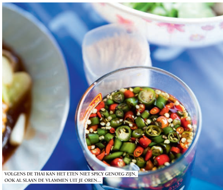
VOLGENS DE THAI KAN HET ETEN NIET SPICY GENOEG ZIJN, OOK AL SLAAN DE VLAMMEN UIT JE OREN...