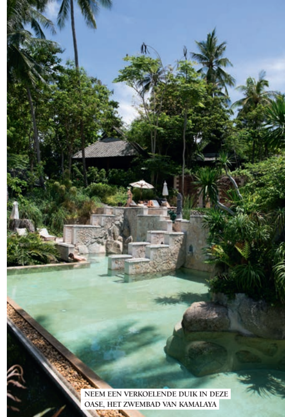
NEEM EEN VERKOELENDE DUIK IN DEZE OASE, HET ZWEMBAD VAN KAMALAYA