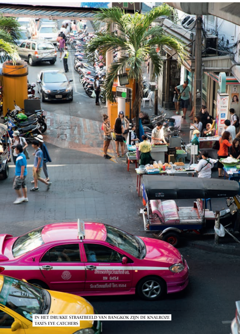
IN HET DRUKKE STRAATBEELD VAN BANGKOK ZIJN DE KNALROZE TAXI'S EYE CATCHERS