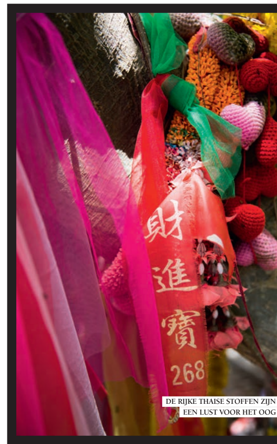
DE RIJKE THAISE STOFFEN ZIJN EEN LUST VOOR HET OOG

De spa van Kamalaya is het kloppende hart van het retreat. Na een steile klim omhoog staat er een rij behandelend therapeuten klaar met lemon tea en ginger drink om verkoeling te bieden voor je behandeling. Het Asian Bliss programma is gefocust op relaxen, dat veel fijne massages betekent. De etherische oliën die gebruikt worden bij onder andere de Thaise, hoofd-, hand- en voetmassages voeden de huid en prikkelen alle zintuigen. Vergeet vooral niet een Shirodhara behandeling te ondergaan. In dit Ayurvedische ritueel laat de therapeut druppels olie op je voorhoofd (lees: derde oog) vallen en dat zorgt voor een extreem rustgevend effect. Niet voor niets wordt deze behandeling regelmatig toegepast in psychiatrische instellingen. De beauty treatments zijn al even indrukwekkend als de behandelingen die meer op de binnenkant van het lichaam gericht zijn. Een pedicure bestaat gemiddeld 90 minuten aan het voetenwerk. Vanuit een relaxte ligstoel op grote hoogte zie je de zee, zon en palmbomen terwijl een beautyexpert aan je tenen kriebelt onder begeleiding van de vogels en insecten als achtergrondkoor. De facials, scalp treatments en lichaamsbehandelingen worden uitgevoerd met organic producten van het exclusieve merk Sodashi.