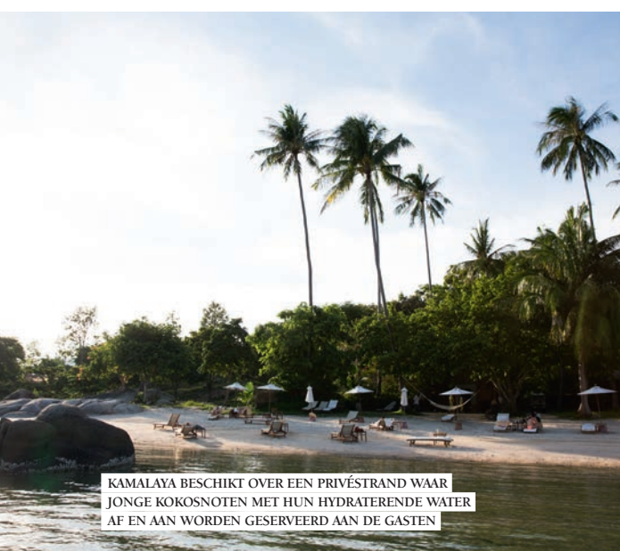
KAMALAYA BESCHIKT OVER EEN PRIVÉSTRAND WAAR JONGE KOKOSNOTEN MET HUN HYDRATERENDE WATER AF EN AAN WORDEN GESERVEERD AAN DE GASTEN

'VEEL VAN ONZE GASTEN KOMEN EENS IN DE TWEE JAAR TERUG VOOR EEN TIENDAAGS VERBLIJF OM EVEN VOLLEDIG LOS TE KOMEN VAN HET DAGELIJKS LEVEN'