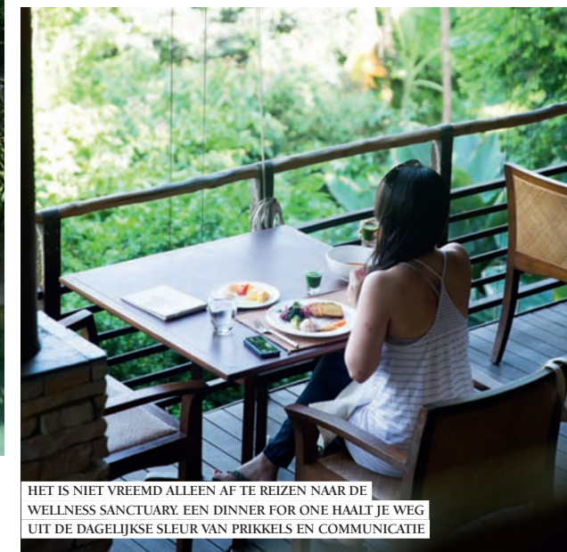
HET IS NIET VREEMD ALLEEN AF TE REIZEN NAAR DE WELLNESS SANCTUARY. EEN DINNER FOR ONE HAALT JE WEG UIT DE DAGELIJKE SLEUR VAN PRIKKELS EN COMMUNICATIE