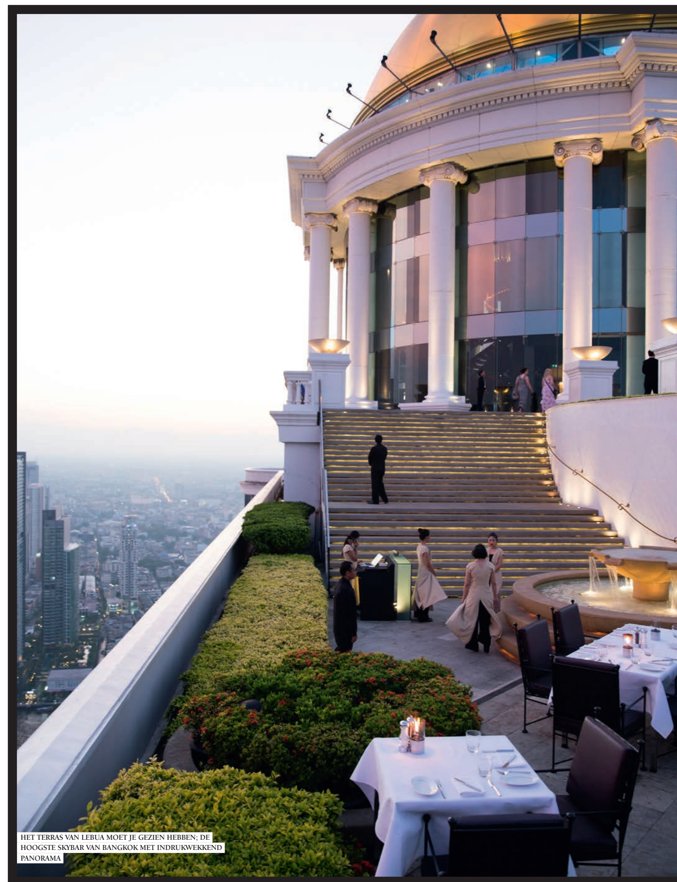
HET TERRAS VAN LEBUA MOET JE GEZIEN HEBBEN; DE HOOGSTE SKYBAR VAN BANGKOK MET INDRIJKWEKKEND PANORAMA

tuinmannen niet genoeg troost bieden). Een uur praten met een astroloog, hypnotherapeut of acupuncturist doet echter wonderen. Net als een plateau zelfgemaakte chocolate chip cookies. Deze staan echter niet op de kaart, want, niet detoxverantwoord. Maar na dagen overleven zonder suikers schreeuwt het lichaam om het gevaarlijke zoethoudertje. Kijk de vriendelijke bediening lief aan en hoop dat net die ene serveerster vooral niet op de hoogte is van je detoxprogramma.