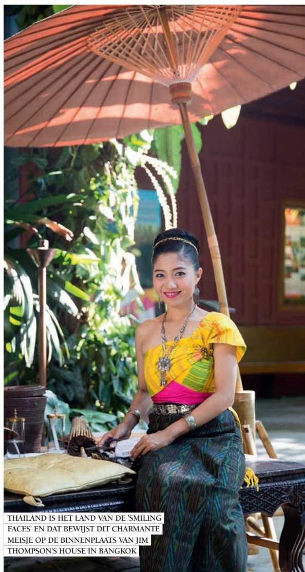
THAILAND IS HET LAND VAN DE 'SMILING FACES' EN DAT BEWIJST DIT CHARMANTE MEISJE OP DE BINNENPLAATS VAN JIM THOMPSON'S HOUSE IN BANGKOK