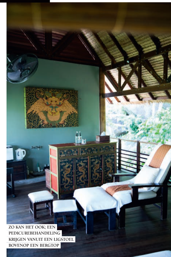
ZO KAN HET OOK; EEN PEDICUREBEHANDELING KRIJGEN VANUIT EEN LIGSTOEL BOVENOP EEN BERGTOP