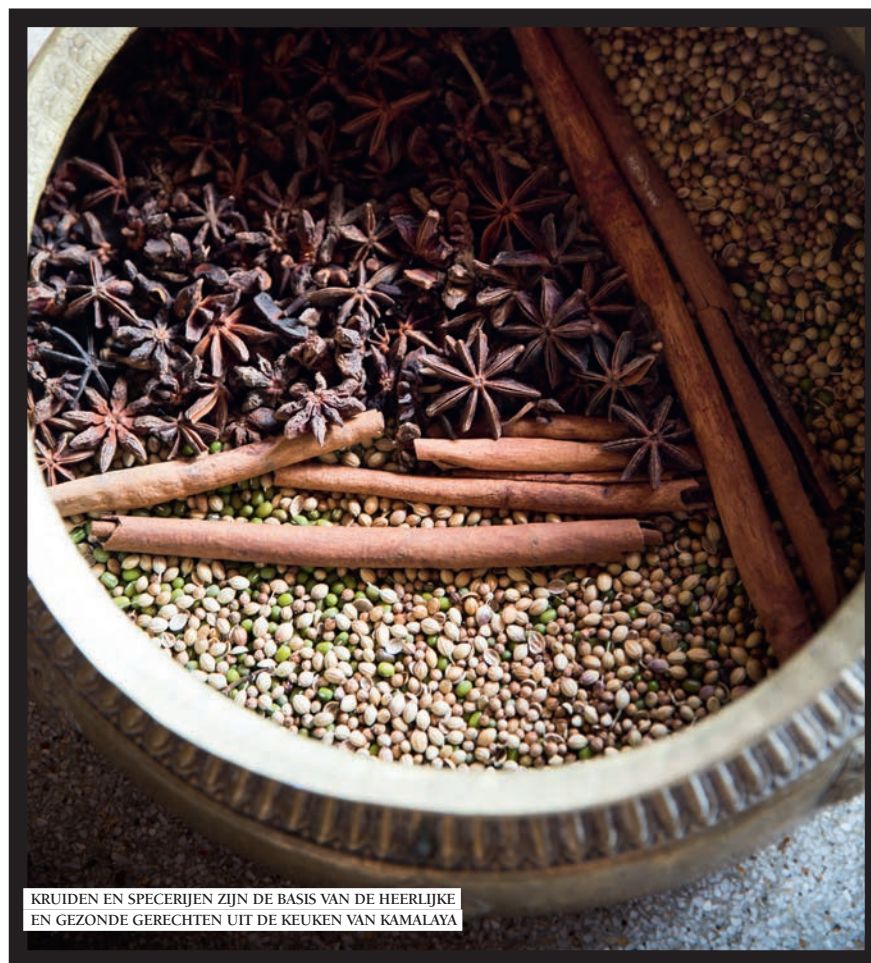
KRUIDEN EN SPECERIJEN ZIJN DE BASIS VAN DE HEERLIJKE EN GEZONDE GERECHTEN UIT DE KEUKEN VAN KAMALAYA