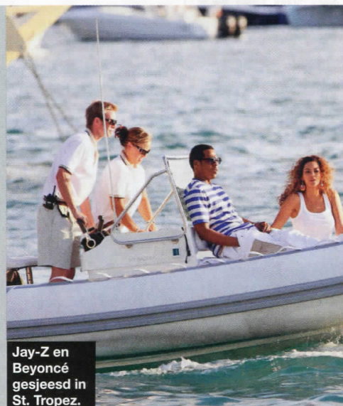
Jay-Z en Beyoncé gesjeesd in St. Tropez.