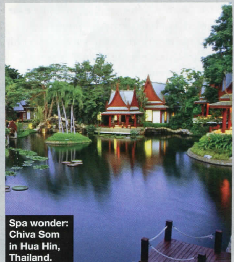
Spa wonder: Chiva Som in Hua Hin, Thailand.