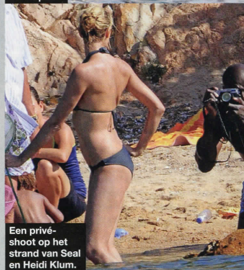
Een privé-shoot op het strand van Seal en Heidi Klum.